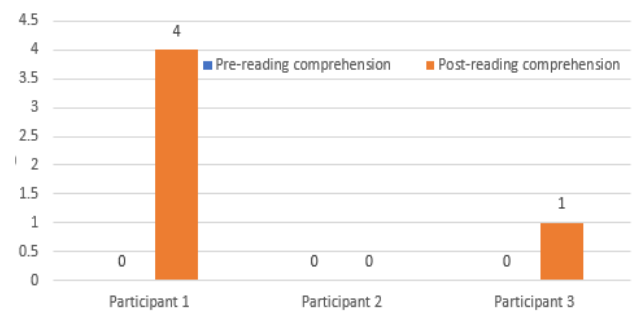
Figure 3. Reading comprehension

일견단어 음운규칙 프로그램 10회기를 진행한 후, 3명의 아동 중 두 명의 아동의 읽기 이해 능력이 향상된 것으로 나타났으며,